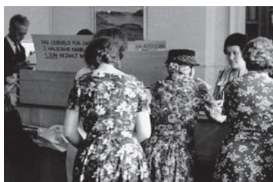
Ausgabe in der «alten Hauptstelle Schmiedehof» am Rümelinsplatz 6, ca. 1965.

Dank ihr sollten die Basler Buben (und erst später dann auch die Mädchen) von «lärmenden Gassenbelustigungen» und «geist- und herzverderbender Langweile» abgehalten werden. Umgeben von Bücherregalen, in denen die vom humanistischen Kanon bestimmten Werke die Tablare durchdrücken, formuliert im Jahre 1807 die Direktion ihre Mission: Der Leselust der Jugend eine unschädliche Richtung zu geben und dadurch die Lektüre «abgeschmackter oder schlüpfriger Romane» zu unterbinden. Die Allgemeinen Bibliotheken der GGG sind damit ziemlich sicher die älteste, in unmittelbarer Folge existierende allgemeine und öffentliche Volksbibliothek der Welt. Federführend bei der Gründung ist die Gesellschaft für das Gute und Gemeinnützige (GGG).