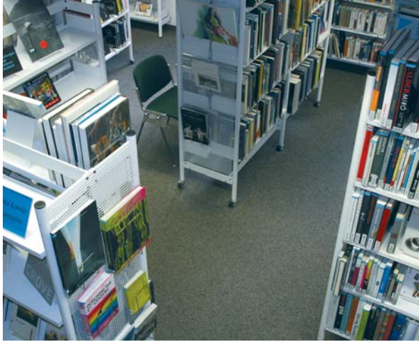
Regalschungel in der Hauptstelle

Vor dreissig Jahren war die Hauptstelle Schmiedenhof die modernste Bibliothek der Schweiz. Seither haben sich die Bedürfnisse und die Anforderungen an eine moderne Bibliothek massiv geändert. So ist die Vielfalt der Medien grösser geworden, deren Präsentation aufwendiger, und Bildungsaufgaben werden immer wichtiger und müssen auch in der Bibliothek wahrgenommen werden. Eine attraktive, Lese- und Lernlust fördernde Bi-