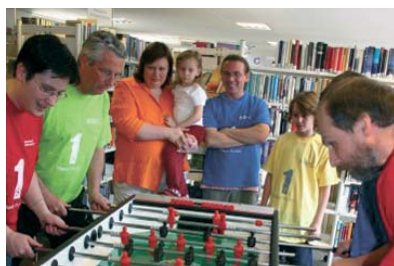
Am 23. April 2006 haben wir den Bibliothekstag mit einem «Töggelturnier» gefeiert. (Die kommende Fussball-WM lässt grüssen!)

Im September 2006 werden wir den 30. Geburtstag der umgebauten und neu konzipierten Hauptstelle Schmiedenhof feiern können. Als Jubiläumsgeschenk hilft uns die