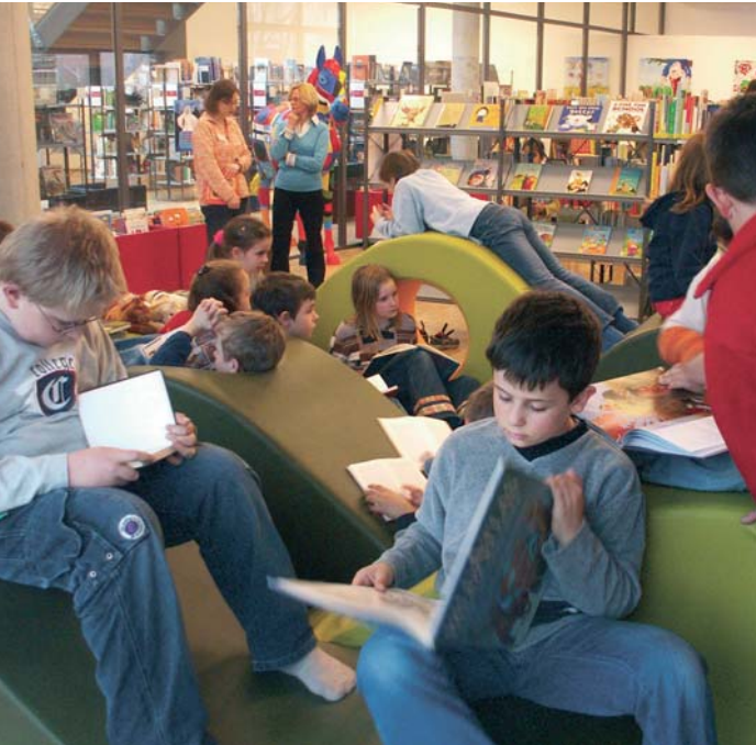
Gut besuchte Kinder- und Jugendabteilung.

Die Stadt Neckarsulm zählt 27 700 Einwohner. Ihre alte, aber gut genutzte Stadtbücherei war in die Jahre gekommen und besass einen ungünstigen Standort. Die Stadtväter planten deshalb 1999 eine neue öffentliche Bücherei in attraktiver Zentrumslage, die als Anziehungspunkt auch zur Belebung der Neckarsulmer Innenstadt beitragen sollte. Als Ziele wurden ferner vorgegeben: