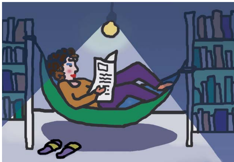
Illustration: Sybille Zürcher

«Wir haben deinen Franken an einem sicheren Ort weggeschlossen», beruhigen wir Nuran.