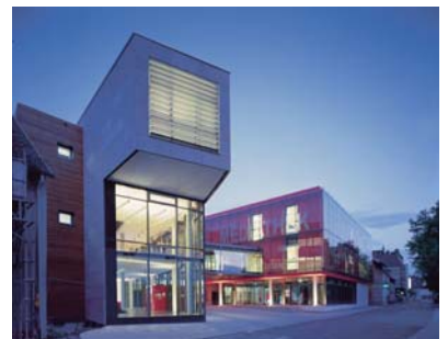
Die beiden markanten Gebäudeteile der Mediathek Neckarsulm. Im oberen Bild ist der Glassteg zwischen dem Nord- (unten rechts) und dem Südbau (unten links) besonders gut sichtbar.