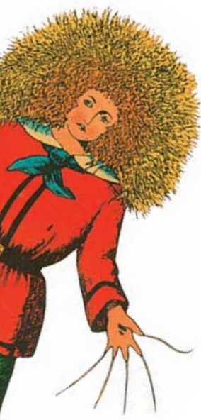
Welches Kind kennt ihn nicht?

Im Sommer des Jahres 1841 trifft Frankenstein in Onkel Toms Hütte den Knecht Ueli. Gemeinsam pilgern sie mit Ritter Harold nach Pompeji. In der Kartause von Parma legen sie einen Zwischenhalt ein und rasonieren über den Untergang des Hauses Usher. Die Diskussion findet mit Struwwelpeter und Karl Marx interessierte Zuhörer.