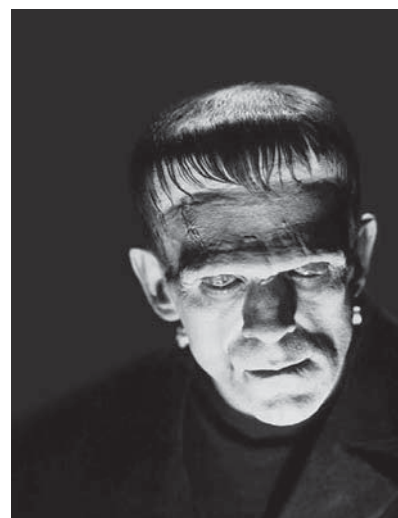
Frankenstein von Mary Wollstonecraft Shelley wurde vor allem durch die Verfilmung mit Boris Karloff (Bild) berühmt.

eröffnet die Hauptstelle Schmiedenhof am 10. September eine Ausstellung mit alten und neuen Bestsellern. Wir zeigen alte Originale und über 230 Bestseller zum Ausleihen. Der älteste Bestseller stammt aus dem Jahre 1810 und die neusten sind auch sonst bei den ABG präsent.