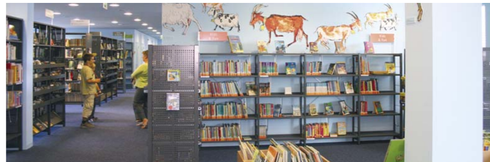
Das helle Blau verleiht der neuen Bibliothek eine grosszügige Atmosphäre.

In luftigen Räumen steht auf 700 m 2 für die Quartierbewohnerinnen und -bewohner der Breite endlich ein breites Angebot von 32 000 Medien (Romane, Sachbücher, Nachschlagewerke, Landkarten, Spiele, Noten, Playstations, Videos, Kassetten, CDs, Sprachkurse, CD-ROMs und DVDs) bereit. Kinder, Jugendliche und Erwachsene haben ihre eigenen Zonen, so dass sie sich gegenseitig nicht stören. Rund 30 Arbeitsplätze, 6 davon mit PCs ausgerüstet, erlauben den Zugang ins Internet oder das Arbeiten mit Büroprogrammen. Ein grosszügiger Lesebereich mit Zeitungen und Zeitschriften er-