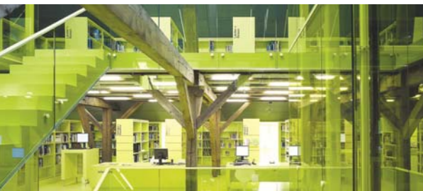
Die neue Kantonsbibliothek besticht durch eine eindrückliche Architektur.