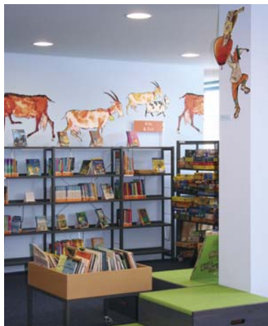
Die neu eröffnete ABG-Bibliothek Breite.