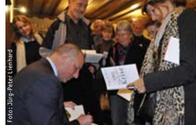
Rückblende im November 2009 mit dem Publizisten und Autor Roger de Weck.