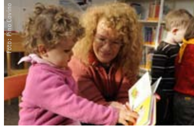
Buchstart-Treff Väršli-Spiel für Kleinkinder im Alter von 9 bis 36 Monaten und ihre Begleitpersonen.