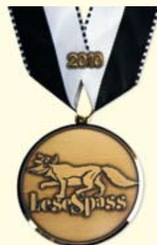
Wer alle Rätsel in den elf beteiligten Bibliotheken richtig löst, erhält neu so eine Medaille.

theken ein Erfolg: Über 8000 LeseSpässe wurden verteilt. 18 Preise wurden verlost und die besonders Rätselbegeisterten, die die Königstour absolviert und alle elf Aufgaben richtig gelöst hatten, erhielten eine Medaille.