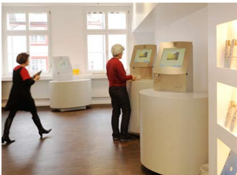
Hell und luftig: so stellen sich die ABG ihre moderne Stadtbibliothek vor. Selbstver- bucher erleichtern und beschleunigen die Ausleihe.

Parallel mit der Einführung von RFID haben die ABG auch die Ausleihzone im zweiten Stock der Bibliothek Schmiedenhof komplett umgestaltet. Dank der Finanzierung durch die GGG konnten wir zu unserer Freude einen hellen und grosszügigen Eingangsbereich schaffen, wie er einer modernen Stadtbibliothek angemessen ist.